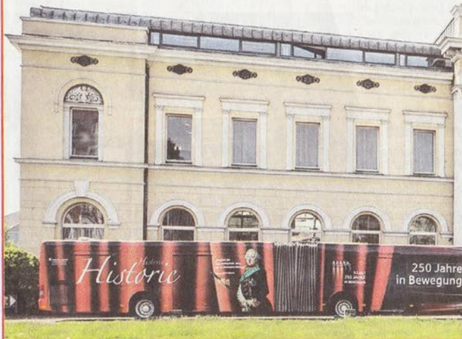
Die Jubiläumsbusse, hier vor dem Hauptsitz der Braunschweigischen Landessparkasse.

am morgigen Montag von 18 bis 22 Uhr auf dem Wolfenbütteler Stadtmarkt